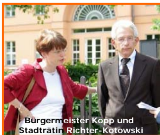
Bürgermeister Köpp und Stadträtin Richter-Kotowski

Nach der Schließung der staatlichen Schauspielbühnen 1993 wurde es als Privattheater mit öffentlichen Zuschüssen weiterbetrieben. Die knappen Kassen des Landes Berlin bewegten schließlich den Senat dazu,