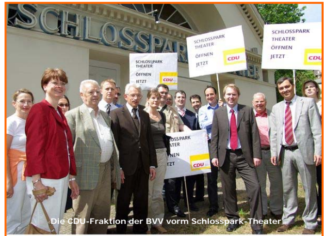
Die CDU-Fraktion der BVV vorm Schlosspark-Theater